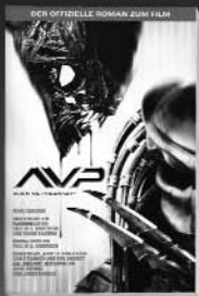
ALIEN VS. PREDATOR: Wer auch immer gewinnt ... wir verlieren. ISBN 3-8332-1145-8