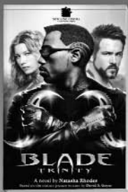
BLADE: TRINITY Der Daywalker ist zurück ISBN 3-8332-1146-6