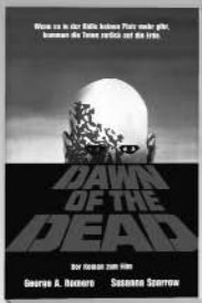
DAWN OF THE DEAD Der Original-Roman zum Zombie-Kultfilm ISBN 3-8332-1115-6