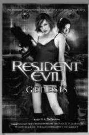
RESIDENT EVIL: Genesis Die Vorgeschichte zu Apocalypse ISBN 3-8332-1130-X