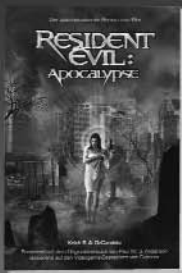
RESIDENT EVIL: Apocalypse Der offizielle Roman zum Film ISBN 3-8332-1127-X